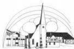
Ev. Kirchengemeinde Lienen